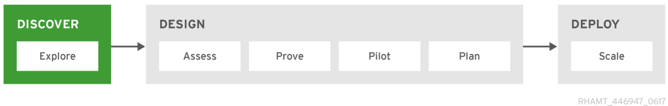
図6.2 Red Hat 移行の方法: 発見フェーズ

発見 フェーズ では、すべての利害関係者と意思決定者を集めて、現在の状態とビジネスドライバーを理解し、移行またはモダナイゼーションのニーズを決定します。