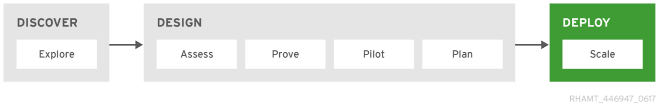
図6.4 Red Hat 移行の方法: デプロイフェーズ

デプロイ フェーズは、設計フェーズで作成したプランを実行する場合です。このフェーズでは、全体的な変換プロセスをスケーリングして計画を完成させ、すべてのアプリケーションを新しい本番環境に導入します。