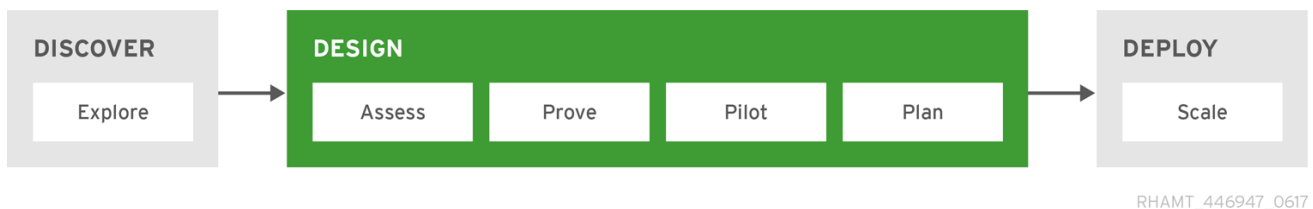
図6.3 Red Hat 移行の方法: 設計フェーズ

設計 フェーズ では、すべてのリスクを特定し、戦略とターゲットアーキテクチャーを定義して、テクノロジーを証明し、ビジネスケースを構築します。このフェーズは、以下の手順で設定されます。