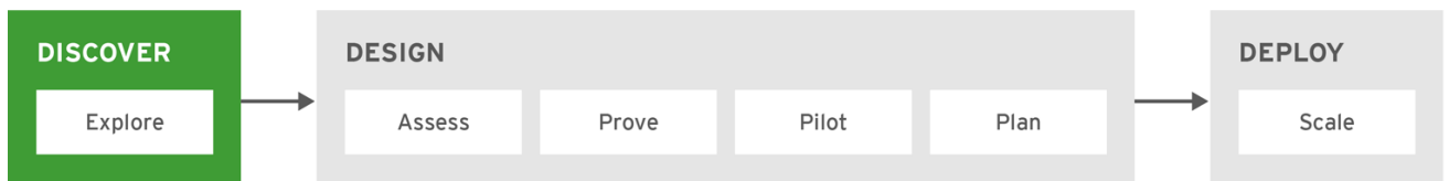
図5.2 Red Hat 移行の方法: 発見フェーズ